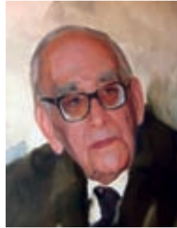
پرفسور سید محمود حسایی (پدر علم فیزیک ایران)