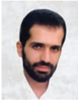
شهید مصطفی احمدی روشن (دانشمند انرژی هسته ای)