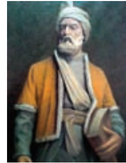
حکیم ابوالقاسم فردوسی (شاعر نامدار)

فعالیت: این پیام قرآنی را در آیات درس پیدا کنید و آن را یک بار دیگر بخوانید.