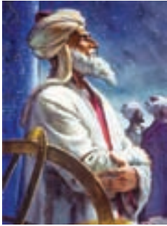
ابوریحان بیرونی (ریاضی دان و منجم)

به کمک تصویر با دوستان خود درباره ی این پیام قرآنی گفت و گو کنید.