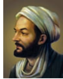
ابوعلی سینا (پدر علم پزشکی)