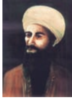
جابرین حیّان (پدر علم شیمی)