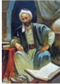
خواجه نصیر (ریاضی دان، منجم، اندیشمند و سیاستمدار برجسته)