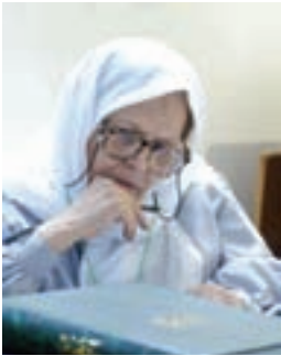
طاهره صفارزاده (مترجم قرآن به زبان فارسی و انگلیسی)