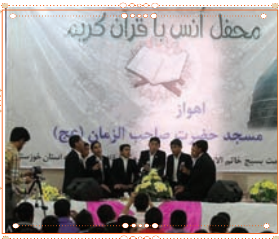
انس با قرآن کریم در استان خوزستان

با راهنمایی آموزگار خود پس از آوردن قرآن کریم از دفتر مدرسه، آن را به صورت تصادفی باز کنید و از روی آن بخوانید.